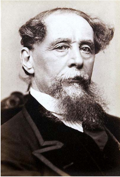
Charles Dickens (1812-1870) around 1867